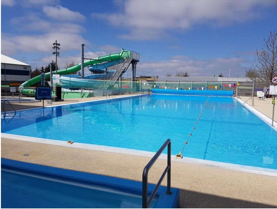
Mynd 1 Sundlaugin Hellu. Hér má sjá yfirbreiðslu upprúllaða.